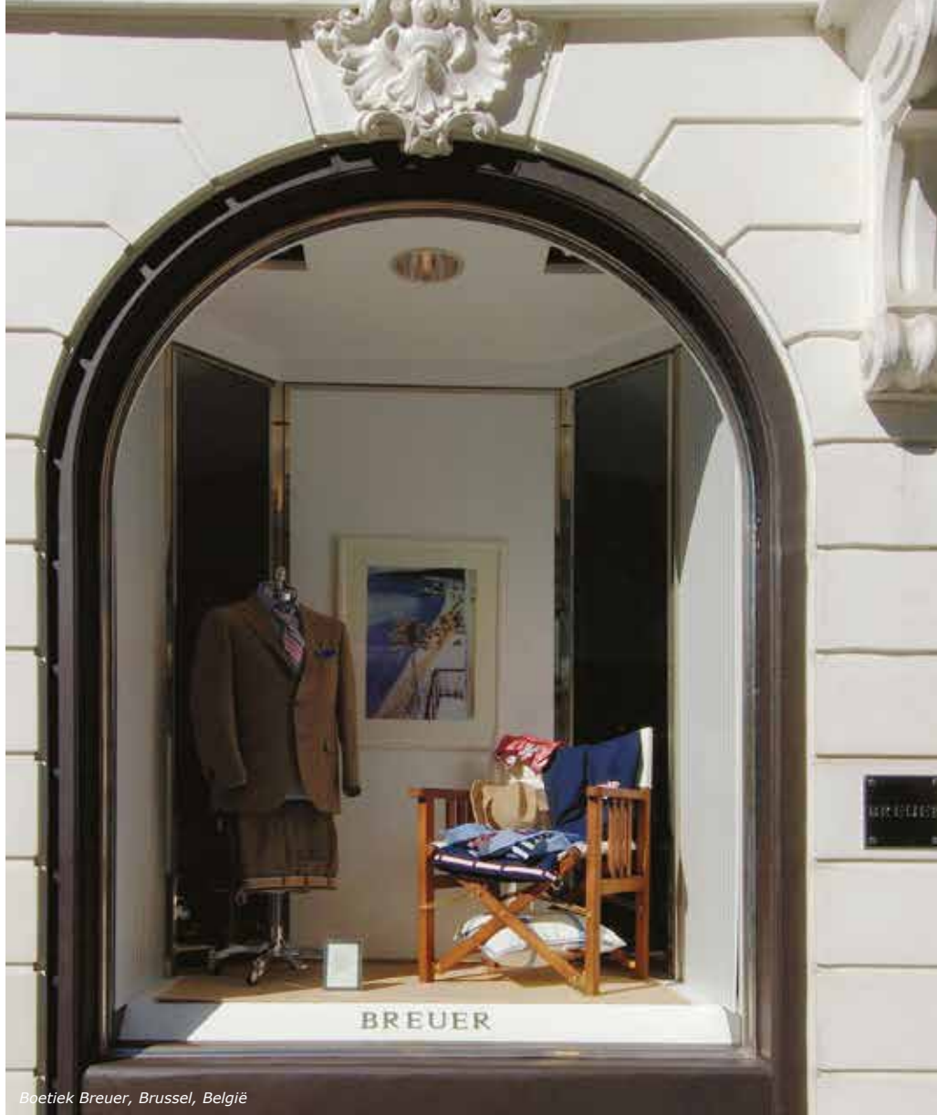
Boetiek Breuer, Brussel, België