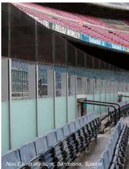
Nou Camp stadion, Barcelona, Spanje

Raadpleeg "SGG VISION-LITE, Gebruiksvoorschriften" en "SGG VISION-LITE, plaatsing, ingebruikname en onderhoud" voor meer informatie.