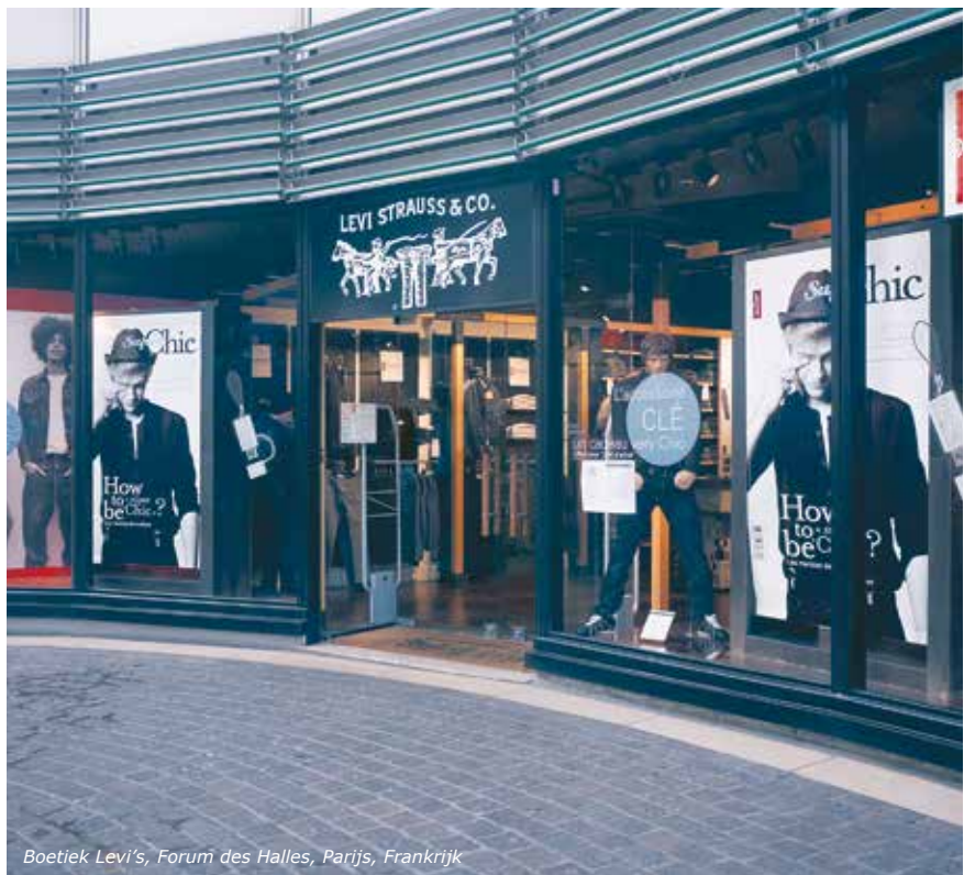
Boetiek Levi's, Forum des Halles, Parijs, Frankrijk