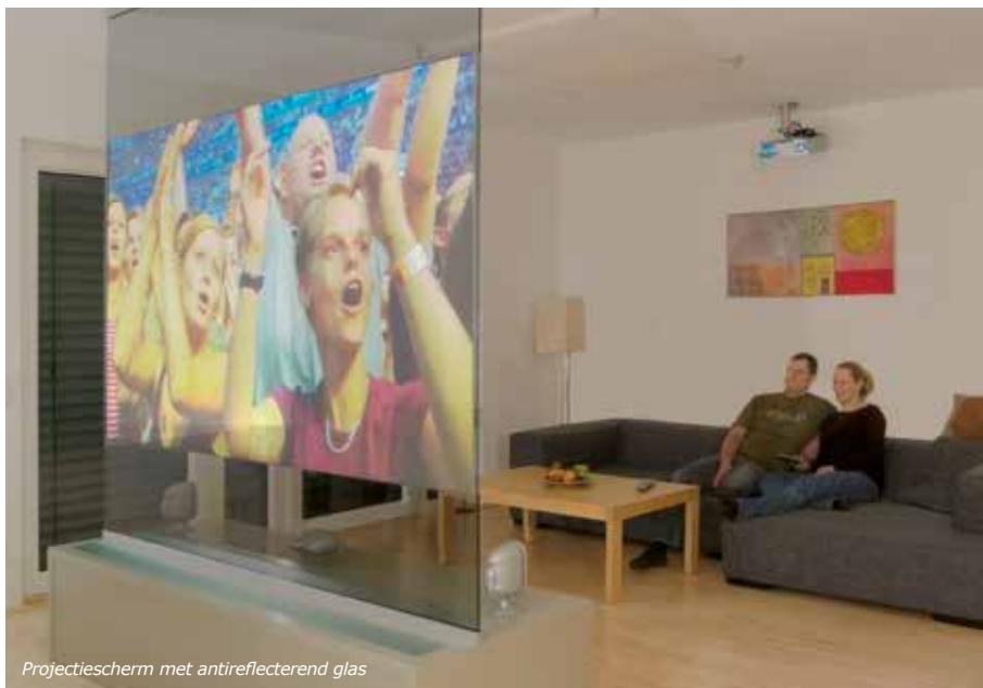
Projectiescherm met antireflecterend glas

Waarden vastgesteld volgens de norm EN410. Reflectiewaarden werden gemeten loodrecht op het glasblad. Zoals bij gewoon glas, vergroot de reflectie onder een schuine kijkhoek. sGG VISION-LITE beantwoordt aan de duurzaamheidseisen van de A-klasse van de Europese norm EN1096.